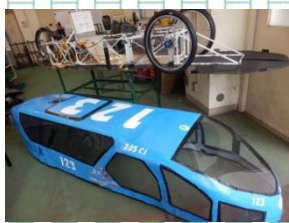
自動車部のリッターカー