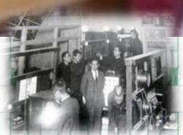
昭和 年頃の電気科授業風景