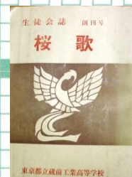
昭和 年 生徒会報創刊号