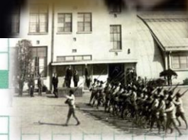
昭和 年、学校でも行われる