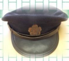
昭和44年まで使用していた制帽