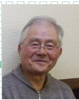
同窓会基金理事長