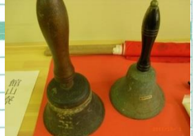
昭和 年まであった館山寮のベル