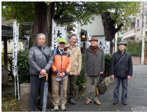
ウォーキング 目白おとめ山散策