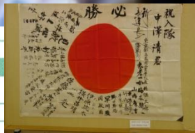
昭和 年、学生出陣を激励する教師寄書