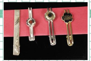
昭和 年頃使用のネクタイピン