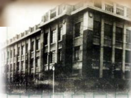
大正14年、浅草で授業開始

記念館には、大正13年開校以来のアルバム・記念品・服飾品・教材などを展示しています。その一部をご紹介します。